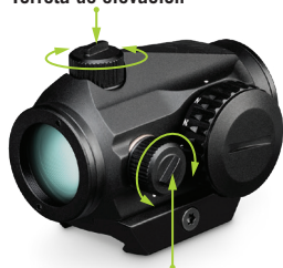
Torreta de deriva

Nota: Cuando se giran las torretas, el punto se desplace en el sentido opuesto.