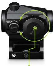
Encendido / Rueda de ajuste de la iluminación

Para encender el Crossfire®, gire la rueda de ajuste de la iluminación hasta que la línea indicadora esté alineada con el ajuste de brillo deseado. La unidad se apaga si la rueda de ajuste de la iluminación vuelve al marcador de cero.