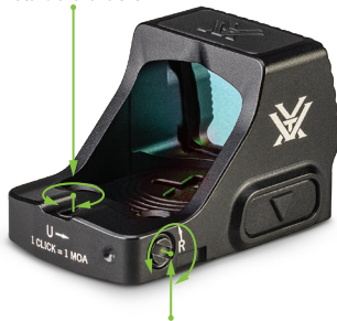
Torreta de deriva